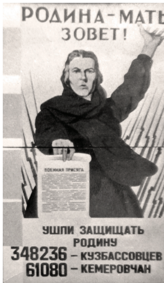
Из серии плакатов «Кузбасс – фронту»

С начала войны и Кемеровский механический завод (КМЗ) начал сворачивать гражданское производство. В сентябре 1941 года завод был передан в ведение наркомата боеприпасов. В кратчайший срок гражданское производство нужно было переорганизовать на оборонное. В Кемерово из Московской области планировали эвакуировать Ногинский завод грампластиков, который до начала Великой Отечественной выпускал не только мирные изделия. Завод входил в систему НКБ (Народный комиссариат боеприпасов СССР) и обеспечивал производство патронов и других снарядов. В ноябре 1941 года на КМЗ прибывают эшелоны с оборудованием и людьми Ногинского завода грампластиков. С установ-