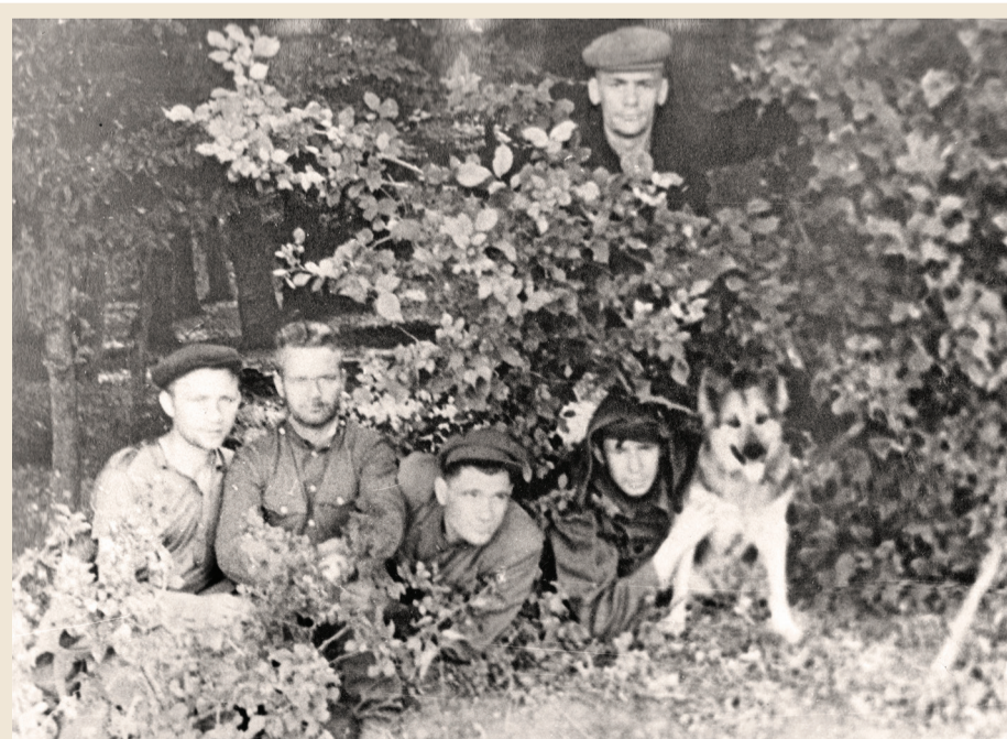
Оперативная группа в засаде. Сотрудники уголовного розыска областной милиции, 1940-е годы

26 января 1943 года была образована Кемеровская область, а уже 28 января этого же года было создано УНКВД (Управление Народного комиссариата внутренних дел) по Кемеровской области.