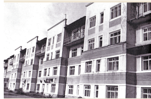
В этом здании на улице Арочная, 41, в 1943–1948 годах размещалось УНКВД по Кемеровской области