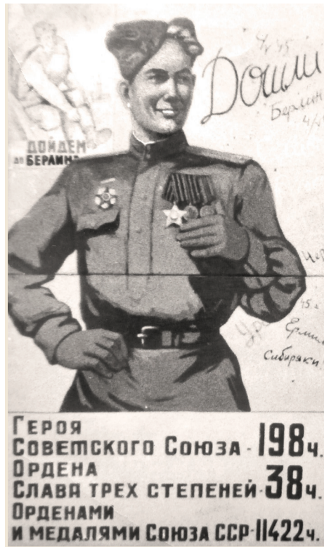
Из серии плакатов «Кузбасс – фронту»

1943 год – год образования Кемеровской области и год создания управления НКВД по Кемеровской области – был переломным в войне против фашизма. Для окончательной победы страна требовала от Кузбасса уголь, металл, продовольствие фронту. Нужны были люди, пушки, танки, автоматы... И Кузбасс внёс неоценимый вклад в победу над фашистской Германией. Несмотря на невероятные трудности, развивались сельское хозяйство и промышленность. Наш регион превратился в мощный