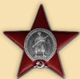
Орден «Красной звезды»