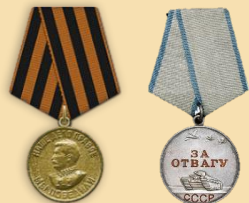
Медаль «За победу над Германией» Медаль «За отвагу»