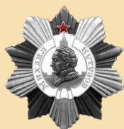
Орден Кутузова II степени