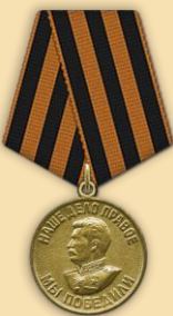
Медаль «За победу над Германией»