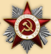
Орден «Отечественной войны II степени»