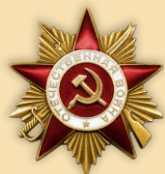
Орден «Отечественной войны I степени»