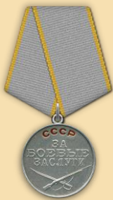
Медаль «За боевые заслуги»