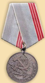
Медаль «Ветеран труда»