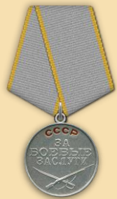
Медаль «За боевые заслуги»