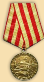
Медаль «За оборону Москвы»