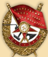
Орден «Красного знамени»