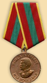
Медаль «За доблестный труд в Великой Отечественной войне 1941-1945»

Родилась в Башкирской ССР д. Кызыл-Ярово. До войны работала в колхозе. До конца войны работала медсестрой в сельском мед пункте.