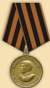
Медаль «За победу над Германией»

Участник Великой Отечественной войны. Родился 29.08.1914 в селе Нестеровка, Карасукского района Алтайского края. Был призван в ряды Красной армии в 1941. Дошел от Москвы до самого Берлина.