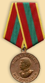
Медаль «За доблестный труд в Великой Отечественной войне 1941-1945»

Родилась 16.12.1922 в селе Кондрашка Тисульского района. До войны работала в колхозе. Во время войны так же работала в колхозе на тракторе, и в пекарне выпекала хлеб, который отправляли на фронт.