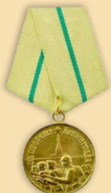
Медаль «За оборону Ленинграда»

Участник Великой Отечественной войны. Александре было 18 лет, когда началась Великая Отечественная война. Сначала пошла на трудовой фронт, в 1941 г, под Ленинград, на Ладожском озере. А летом 1942 г. , в 20 лет , уже в составе СМЕРШа, снова на Ленинградском фронте, на «Дороге жизни». Домой, в Вологодскую область вернулась в ноябре 1945г., после Дальневосточного фронта.