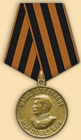
Медаль «За победу над Германией»

Участник Великой Отечественной войны. На фронт отправился в мае 1943 года. На тот момент был курсантом белоцерковского военно-пехотного училища. Победу встретил в Австрии.