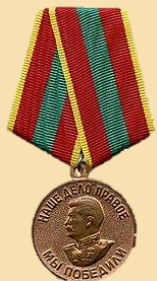
Медаль «За доблестный труд в Великой Отечественной войне 1941–1945 гг.»