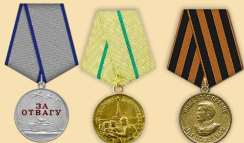
Медаль «За отвагу»