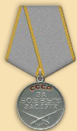
Медаль «За боевые заслуги»