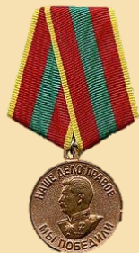
Медаль «За доблестный труд в Великой Отечественной войне 1941–1945 гг.»

С декабря 1942 года по декабрь 1946 года работал секретарем Кемеровского сельского РК КПСС.