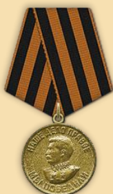
Медаль «За победу над Германией»