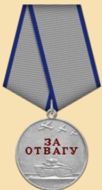
Медаль «За отвагу»