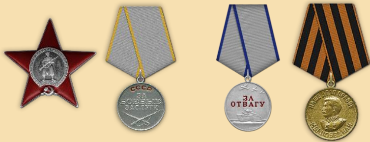
Орден «Красной звезды» «За боевые заслуги»

В 1945 году поступил в Московский Военный Институт Иностранных Языков. Он стал кадровым военным, дипломатом. Работал за рубежом, в совершенстве владел иностранными языками. Он всю свою жизнь служил нашей Родине, был крайне честным, образованным и порядочным человеком.