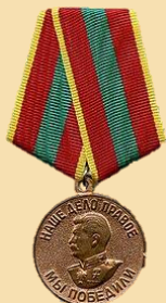
Медаль «За доблестный труд в Великой Отечественной войне 1941–1945 гг.»