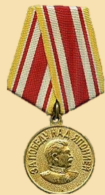
Медаль «За победу над Японией»

Призван Щегловским Уезным военкоматом в марте 1920г. к строевой службе и зачислен в 48-стр. полк и получил воинское звание рядовой. Служил в артиллерийском полке с 1941 по 1944 под орудийным номером 76. Позже был госпитализирован по ранению, но продолжил службу в 6-ом артиллерийском полке. В сентябре 1945 г. Демобилизован на основании Указа Президиума ВС СССР от 26.09.1945г.