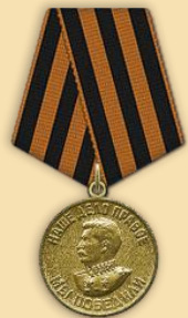
Медаль «За отвагу»

Места службы: 195 сд; 213 азсп 37 А; 188 сд; 352 отдельный саперный батальон 188 стрелковой дивизии; 573 стрелковый полк 195 стрелковой дивизии (1)