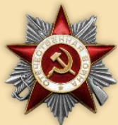
Орден «Отечественной войны I степени»