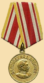
Медаль «За победу над Японией»