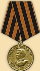
Медаль «За победу над Германией»