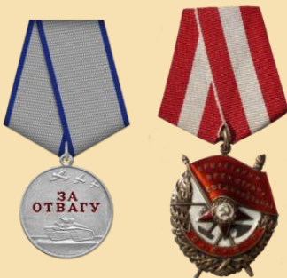
Медаль «За отвагу» Орден «Красного знамени»

21 января 1945 года он получил тяжелое ранение в левое плечо и в левую ногу.