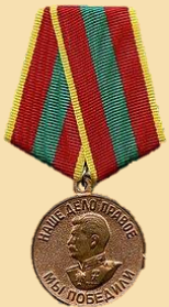
Медаль «За доблестный труд в Великой Отечественной войне 1941–1945 гг.»

Места службы: 1234 стрелковый полк 370 стрелковой дивизии.