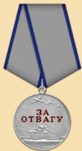
Медаль «За отвагу»