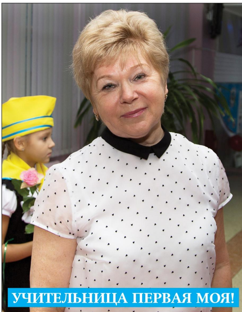
УЧИТЕЛЬНИЦА ПЕРВАЯ МОЯ!

Наверное, не стоит говорить, насколько профессия учителя является непростой. Особенно, в современное время. Учитель должен не просто обучать языку или математике, но прививать детям нравственное начало и духовные ценности. Так что, на учителей возложена важная миссия по воспитанию столь сложной и противоречивой современной молодежи.